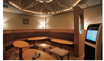
カラオケルーム「樹水」2F