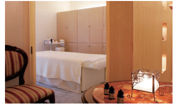
エステ&ネイルサロン1F