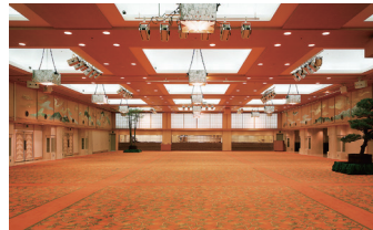
コンベンションホール「紅の花」3F