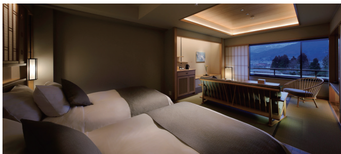
「雪の館」客室 | Guest room "Yuki Wing"