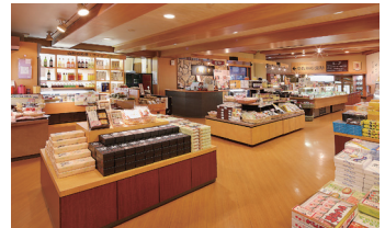
売店「奥の細道 のれん街」1F