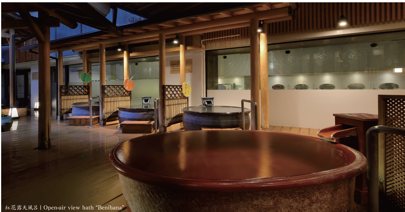
紅花露天風呂 | Open-air view bath "Benibana"

〈効能〉 天然の保湿成分であるメタケイ酸を 多く含む、美肌の湯です。 また上山温泉は、あつたまりの湯」とし て知られております。