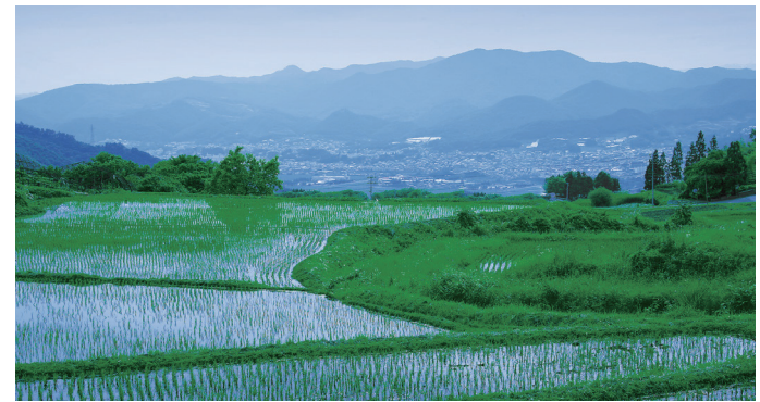
蔵王半郷地区から望む上市市内