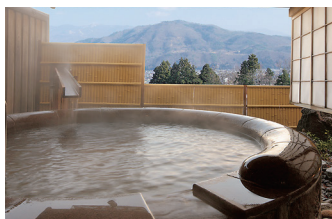
露天風呂付客室「御所」 Guest room with Open-air bath "Gosyo"