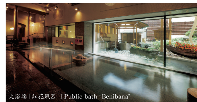
大浴場「紅花風呂」| Public bath "Benibana"