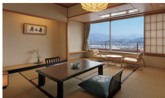
「月の館」客室 | Guest room "Tsuki Wing"