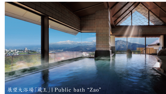
展望大浴場「蔵王」| Public bath "Zao"