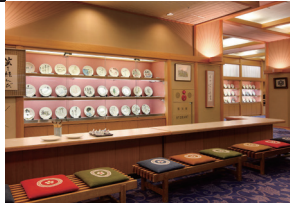
陶芸「楽焼画房」 Ceramic "Rakuyaki gabo"

古窯には、お客様も素焼きのお皿等に絵付けをお楽しみいただける「楽焼画房」がございます。夜9時まで営業。翌朝お持ち帰りいただけます。