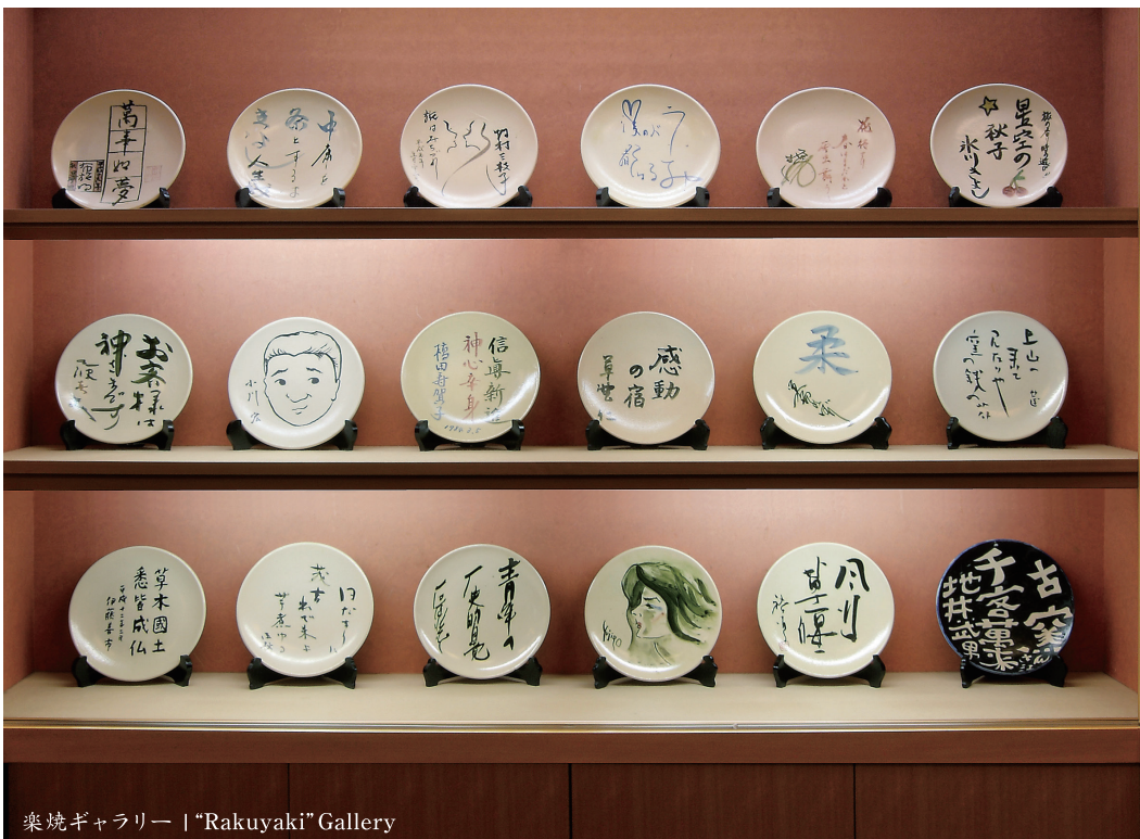
楽焼ギャラリー | "Rakuyaki" Gallery