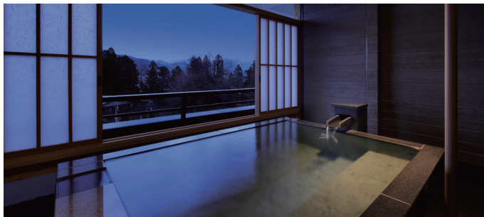
「雪の館」客室 | Guest room "Yuki Wing"