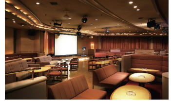
クラブ「21トゥエンティ・ワン」2F