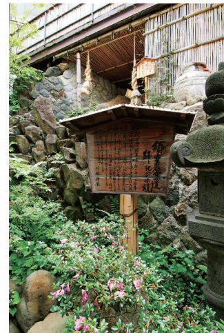
山形県指定文化財の窯跡 Kiln Ruins

館内にある各界の著名な方々の作品を展示した楽焼ギャラリーは、これまで古窯が頂戴してきたご縁そのもの。懐かしきふるさとの面影を残すここ山形の風土・風景・風味が織りなす出会いを、古窯はお客様との末長いおつきあいとして大切にしていきたいと思えます。