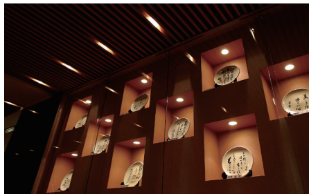
楽焼ギャラリー | "Rakuyaki" Gallery