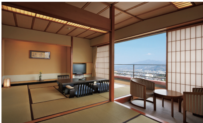
「花の館」客室 | Guest room "Hana Wing"