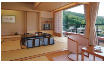
「緑の館」客室 | Guest room "Midori Wing"