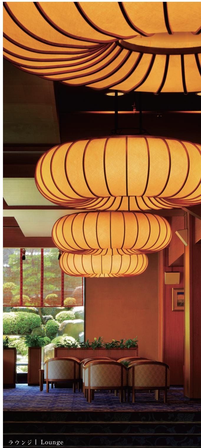
ラウンジ | Lounge

Koyo is located at the nature abundant hot springs of Kaminoyama, Yamagata Prefecture. The picture above shows a view of Kaminoyama taken from the Zao Mountainside.