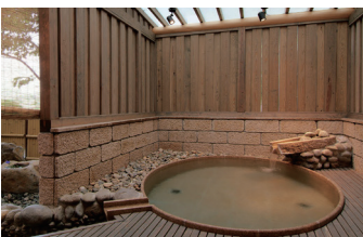
露天風呂付客室「朝日」 Guest room with Open-air bath "Asahi"