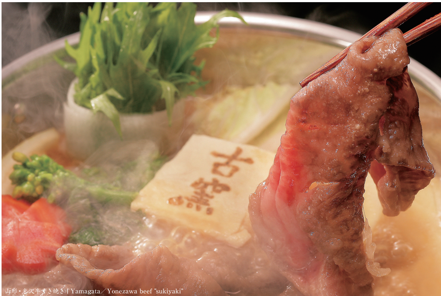
山形・米沢牛すき焼き | Yamagata / Yonezawa beef "sukiyaki"