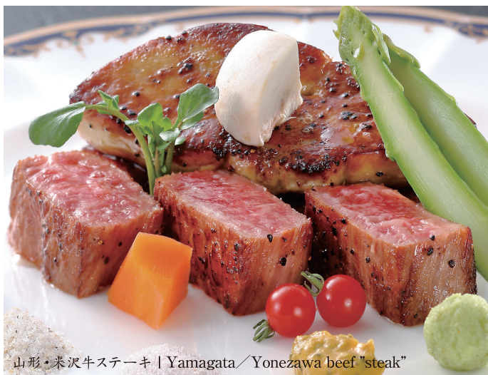
山形・米沢牛ステーキ | Yamagata / Yonezawa beef "steak"