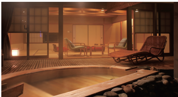
露天風呂付客室「摩耶」 | Guest room with Open-air bath "Maya"