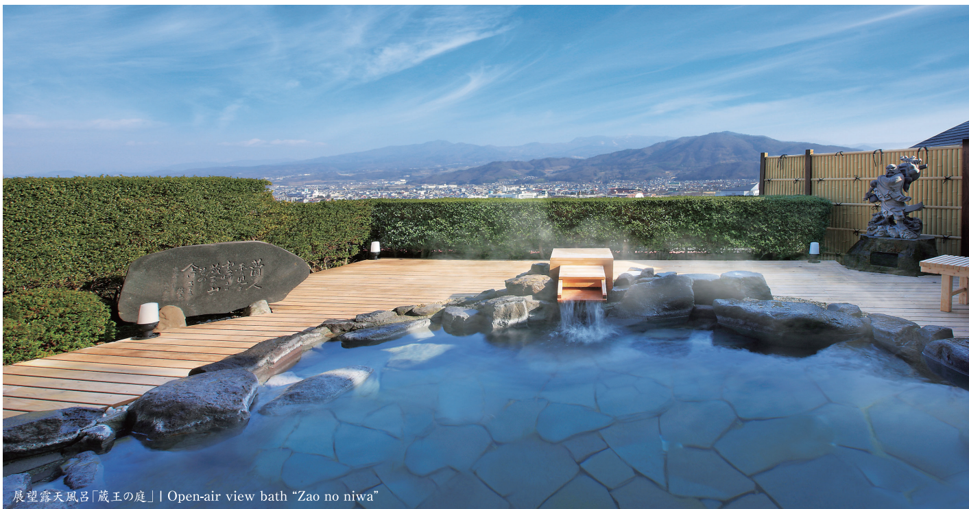
展望露天風呂「蔵王の庭」| Open-air view bath "Zao no niwa"